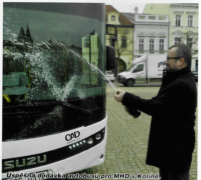
Uspěšná dodávka autobusů pro MHD v Kolíně.