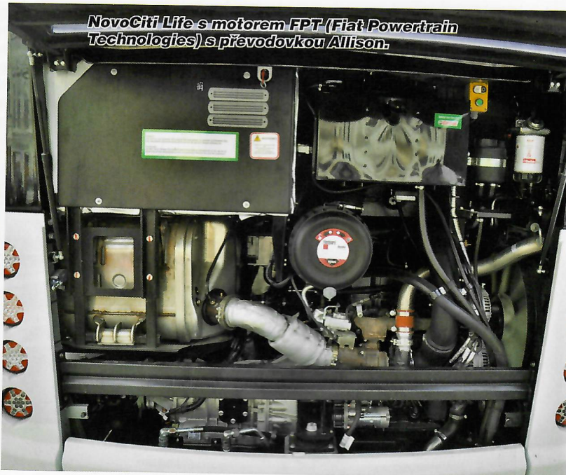
NovoCiti Life s motorem FPT (Fiat Powertrain Technologies) s převodovkou Allison.