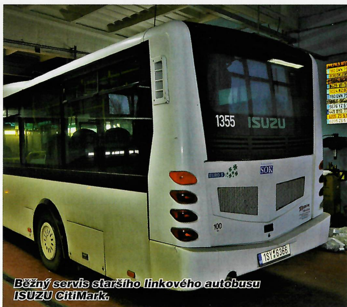
Běžný servis staršího linkového autobusu ISUZU CitiMark.

patří funkčnost, trvanlivost a komfort pro cestující a řidiče. Všechny tyto a další parametry byly zohledněny při rozhodování poroty a udělení zlatého ocenění A'Design Award.