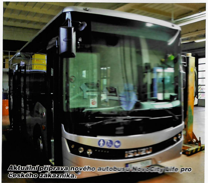
Aktuální příprava nového autobusu NovoCity Life pro českého zákazníka.

Na přední masce upoutává ostrá černá kontura s rozdělenými designovými světlometry. Esteticky dobře působí aerodynamický kryt palivových nádrží na CNG. Zcela nové je ztvárnění pracoviště řidiče a celého interiéru s použitím nejmodernějších progresivních materiálů ABS (akrylonitril butadien styren; jde o termoplastický polymer), PU (polyuretan), PVC, Formica (lamináty), hliníku, vinylu a dalších kompozitů.