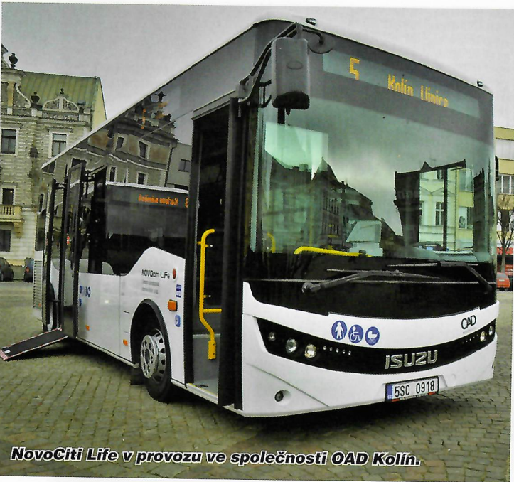
NovoCiti Life v provozu ve společnosti OAD Kolín.