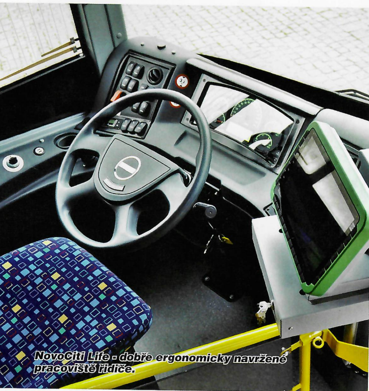
NovoCiti Life - dobře ergonomicky navržené pracoviště řidiče.