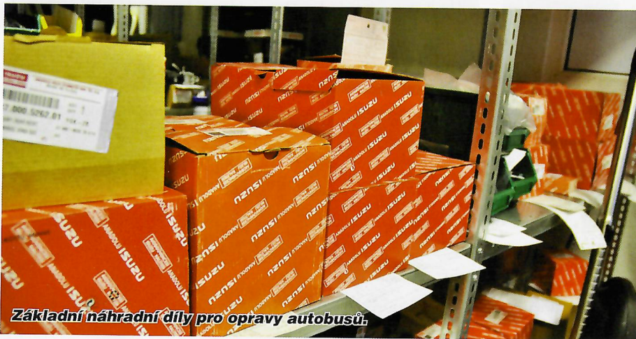
Základní náhradní díly pro opravy autobusů.