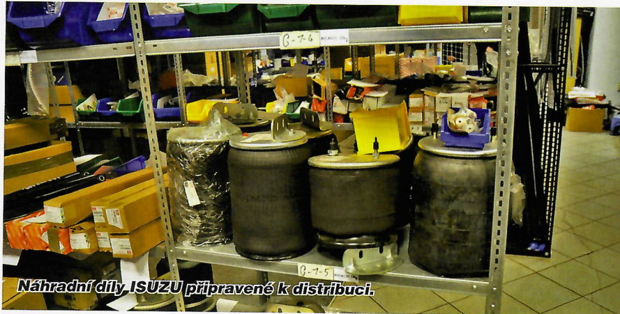
Náhradní díly ISUZU připravené k distribuci.

V areálu společnosti sice od jara stojí celá řada nových, neprodaných turistických autobusů, koronavirus ale jednou poleví na své síle a znovu se rozběhne cestování. Pak odjedou i tyto autobusy ze dvora ke svým zákazníkům.