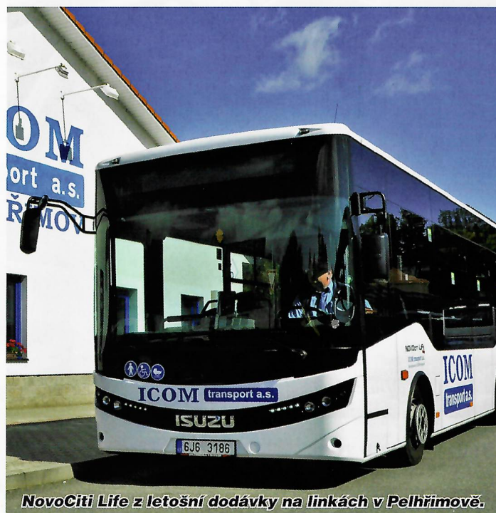
NovoCiti Life z letošní dodávky na linkách v Pelhřimově.

Náklady na pořízení, následně i na údržbu a vlastní provoz autobusu jsou pro majitele a provozovatele mimořádně důležité při rozhodování o nákupu nových vozidel. Mezi hlavní požadavky také