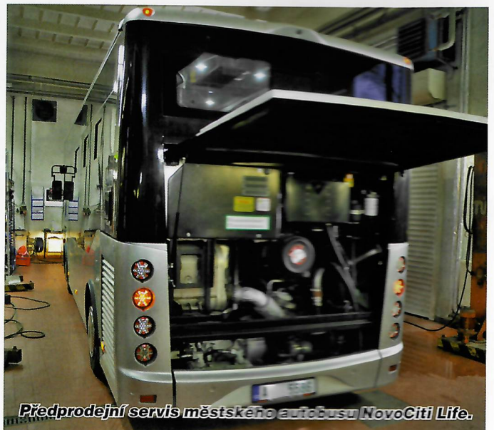
Předprodejní servis městského autobusu NovoCity Life.