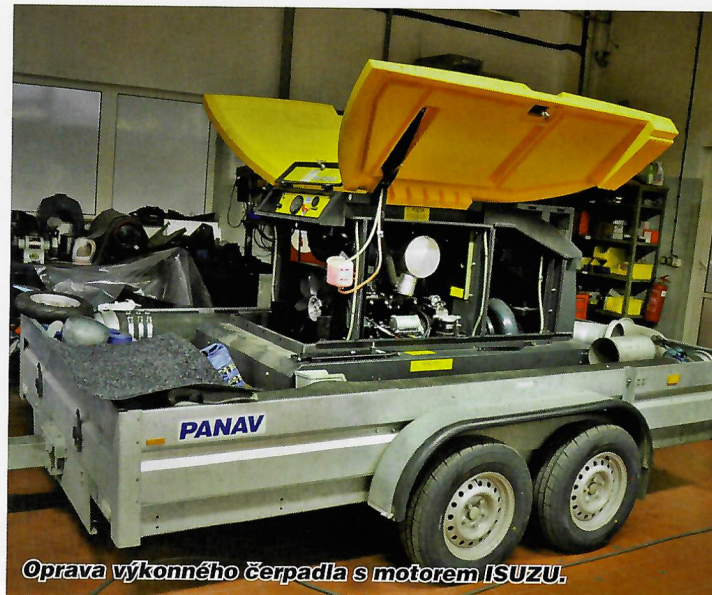
Oprava výkonného čerpadla s motorem ISUZU.