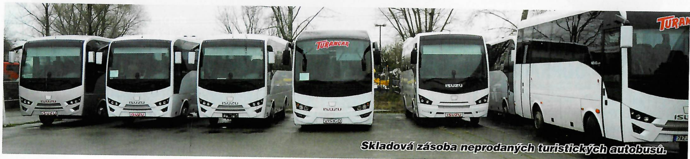
Skladová zásoba neprodaných turistických autobusů.

sektorů, než je turismus, například vyhrála výběrové řízení na dodání autobusu pro Policejní prezidium ČR, automobilní odbor.