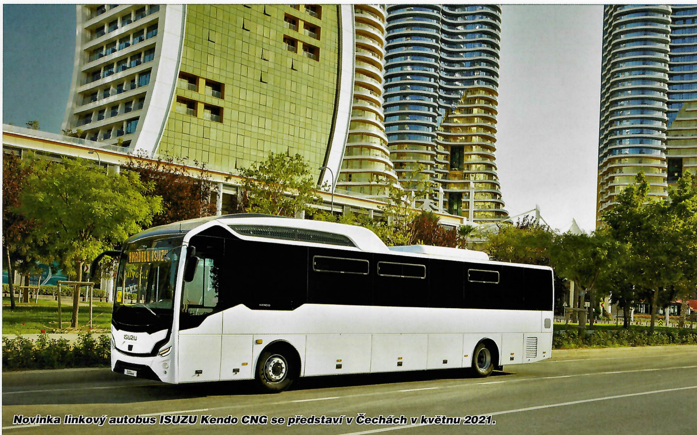
Novinka linkový autobus ISUZU Kendo CNG se představí v Čechách v květnu 2021.

KENDO je výsledkem komplexního projektu vývojářů Anadolů ISUZU, uskutečněného v letech 2018 – 2020. Základní definicí při zadávání projektu byl průzkum trhu, porovnávání s existujícími produkty společnosti Anadolu Isuzu a její know-how. Důležité bylo správně nastavit výchozí bod vývoje s cílem zvýšit ergonomii, použitelnost, trvanlivost a produktivitu výrobního procesu. Došlo také k analyzování pokroku v jiných průmyslových odvětvích, nastávajících trendů a tendence vývoje nových tvarů spolu s výzkumy barev, materiálů a povrchových úprav.