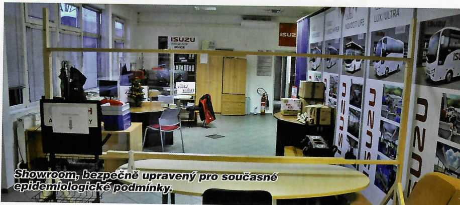
Showroom, bezpečně upravený pro současné epidemiologické podmínky.