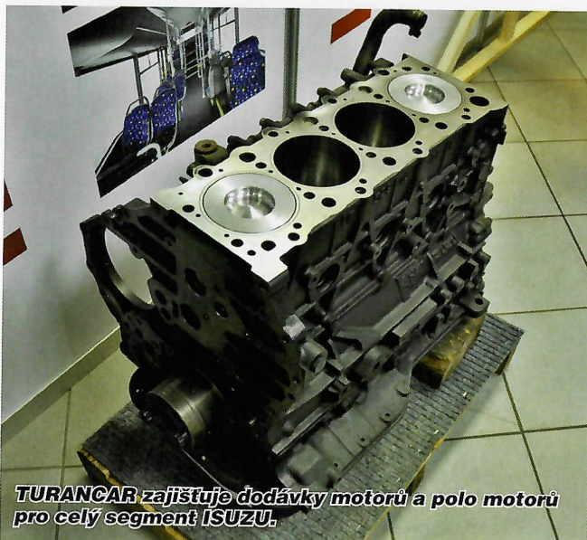
TURANCAR zajišťuje dodávky motorů a polo motorů pro celý segment ISUZU.

Hned od samého počátku pozoruhodný městský „midibus“ zaujal i v Čechách. Letos, i přes celkově nepříznivé klima ve společnosti, se podařilo do ČR přivést prvních šest NovoCiti Life.