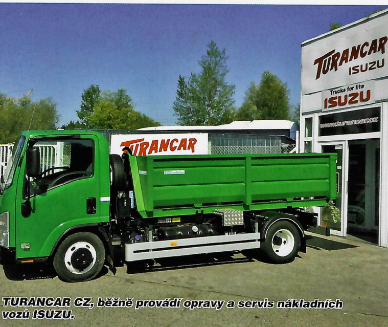
TURANCAR CZ, běžně provádí opravy a servis nákladních vozů ISUZU.